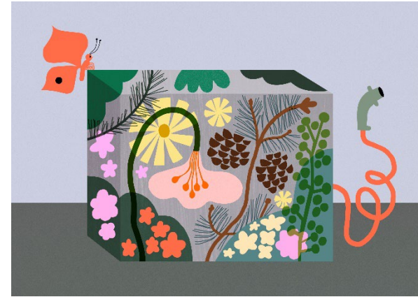
Hållbara förnybara drivmedel