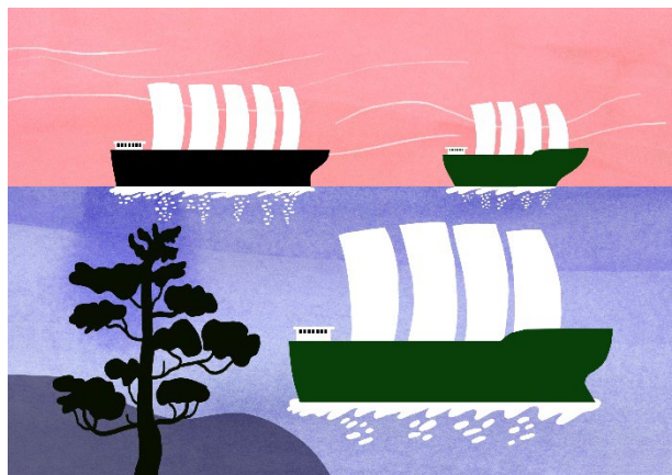
Energieffektiva fordon och fartyg